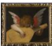
Giovanni Battista di Jacopo detto Rosso Fiorentino Angelo musicante 1890, n. 1505

Mostra: Pechino, National Art Museum, 18 aprile- 18 luglio 2026