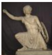
Guerriero ferito Sculture (1914), n. 232