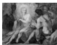
Mannozi Giovanni detto Giovanni da San Giovanni Apollo e Marsia 1890, n. 5429

Mostra: Pechino, National Art Museum, 18 aprile- 18 luglio 2026