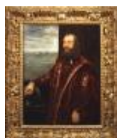
Robusti Jacopo detto Tintoretto Ritratto d'ammiraglio veneziano 1890, n. 921

Mostra: Pechino, National Art Museum, 18 aprile- 18 luglio 2026