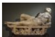
Bernini Gian Lorenzo San Lorenzo sulla graticola Contini Bonacossi, n. 36

Mostra: Roma - Musei Capitolini, 27 novembre 2025 - 12 aprile 2026