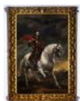
Van Dyck Antonie Ritratto di Carlo V a cavallo 1890, n. 1439

Mostra: Pechino, National Art Museum, 18 aprile- 18 luglio 2026