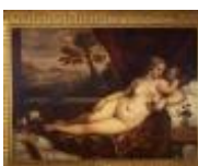
Vecellio Tiziano, attribuito a Venere e Amore con un cane e una pernice 1890, n. 1431

Mostra: Genova, Palazzo Ducale, Appartamento del Doge, 21 marzo - 19 luglio 2026