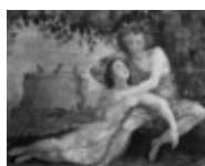
Mannozi Giovanni detto Giovanni da San Giovanni Bacco e Arianna 1890, n. 5428